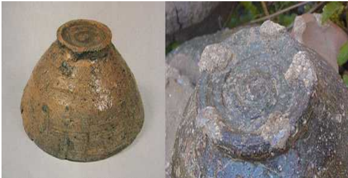
(좌) 굽에 굽게 아리랑 문양이 있는 양산거친아리랑굽

양산의 법기리에 가장 많이 만들어진 찻사발이다. 철분이 많은 점토에 모래가 혼합된 독특한 태도를 사용했으며 굽 부분에서 허리에 걸친 칼자국 자리가 폭이 넓으며 구연부(차를 마실 때 입에 닿는 부분.) 처리가 획일적인 것을 거부하고 자유정신을 추구하는 조선 사기장의 여유를 느낄 수 있다.