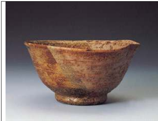
양산이종유사발, 분류명 이라보편신체 다완 (伊羅保片身替茶碗) 카타미카와리 자완. 가네자완시립중촌 기념관

약토는 높은 산에 가보면, 나무밑에 잎이 썩어서 된, 시커먼 흙을 말합니다. 필자는 이것을 반약토사발이라 명명했습니다.