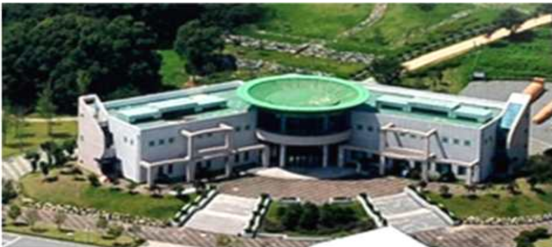
(그림2 강진 도예문화원)

1층에는 단국대 부설 ‘강진도예연구소’가 개소하여 태토, 유약, 등 재료의 성분 분석을 통한 계량화, 디자인 개발 등, 청자와 도자산업의 발전을 위한 연구를 목적으로 연구실과 제품개발실, 15대의 전동물레를 갖춘 실습실, 전기가마가 설치된 소성실 그리고 시청각실로 구성되어 있다. 2층에 마련된 일반전시실에는 지난 78년부터 현재에 이르기까지 강진사업소에서 재현한 작품 50여점과 공모전 수상작을 전시하고, 기획전시실에는 지역 작가들의 작품과 해외 작품 등 현대 청자를 주로 전시한다.