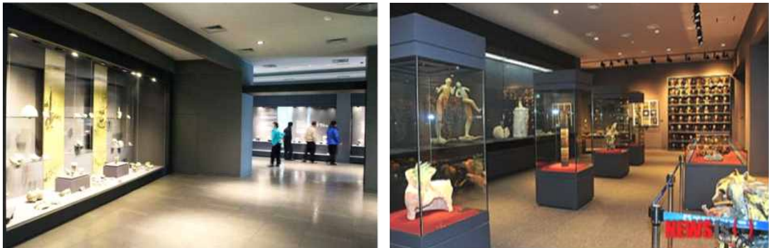
(그림10 부안 청자 박물관)

우리 도자기의 역사, 선화봉사고려도경과 고려청자,한 눈에 보는 부안청자 유천리 7구역 청자가마터 발굴유물, 고려 상감청자 무늬, 고려청자의 역사