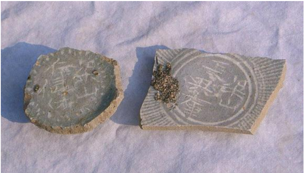
분청사기이다. 양산 인수부, 양산 장흥고 사금파리

양산은 조선초기에 도자기를 빚어 장흥고나 인수부 글자를 새겨 궁중에 납품 하던 고장 중 하나였다.