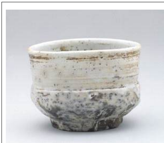
백각굽 사발. 일본분류명 : 어소환다완(御所丸茶碗) 고쇼마루자완. 유키미술관 소장

필자가 각급사발이라는 분류명을 붙인 이유는 이것들의 굽은 모두 칼로 깎아 각지게 만들었기 때문입니다.