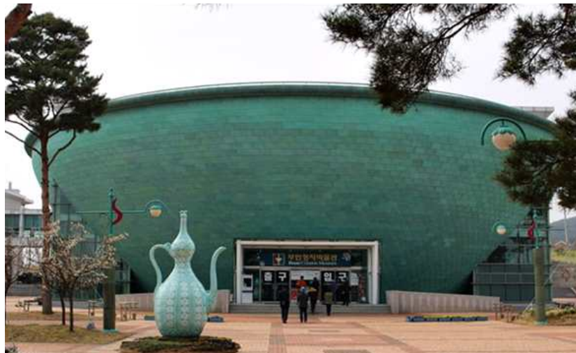
(그림9 부안 청자 박물관)