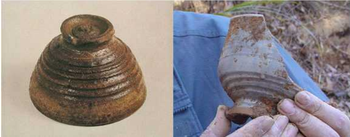
(좌)는 양산거친아리랑굽사발이라는 것이다. 그러나 (우)는 거친아리랑굽사발은 아니나 형태가 아주 닮아있다. 백자계통의 사금파리이다. 이것은 양산 범기리에서 아주 다양한 사발을 구웠다는 것을 알 수 있다.