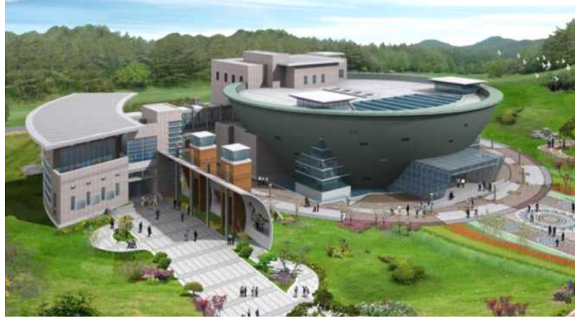
(그림8 부안 청자 박물관 조감도)

부안 청자 박물관은 1층과 2층 전시장에서 청자의 제작과정을 비롯해서 청자 역사실과 상감청자의 아름다움을 감상할 수 있는 청자명품실이 있다.