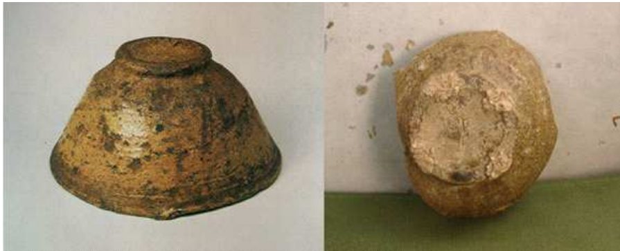
일본 소재 이라보다완과 볽기리 출토 사금파리