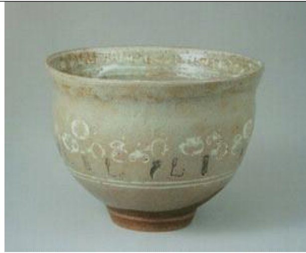
일본분류명 ; 어본다완(御本茶碗) 고훈자완, 개인소장