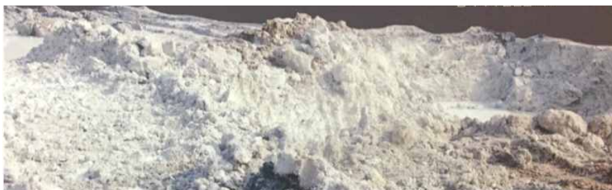
(그림14 양구 백토)

장평리에서는 7기, 칠전리 5기, 현리 4기, 송현리 7기, 금악리 4기, 오미리 4기, 상무룡리 9기 등 총 40기가 확인되었다. 약 7개 지역에서 백자를 제작할 때 사용했을 것으로 추정되는 원료를 확인하였다. 조선후기 왕실 분원에서 생산되던 백자원료의 주요 공급처 가운데 하나가 양구군이었으므로 원료 수급 관계를 통한 광주 분원백자와의 연관성을 알려준다. 실제로 양구에서 채집되는 백자, 청화백자 등은 특히 조선후기 분원백자와의 조형적으로 상호관계가 매우 높다.