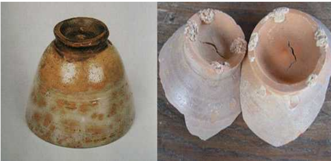
(좌)는 어본이라 부르는 부산 왜관에서 만든 사발이다. 눈박이는 떼어내어 사용했기에 잘 보이지 않는다. (우)는 양산 범기리의 사금파리다. 같은 종류로 보여진다.