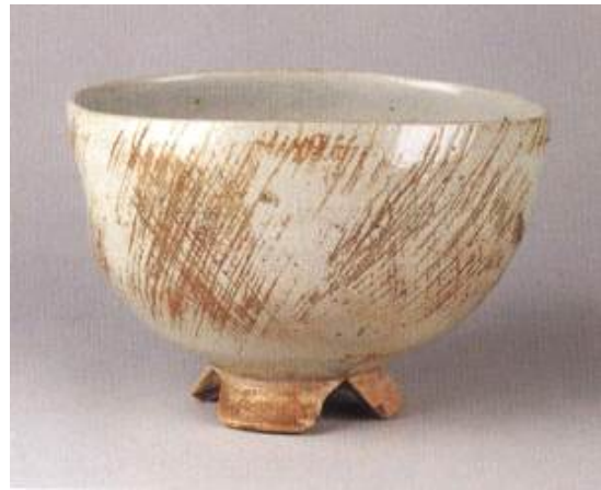
일본분류명, 김해다완 (金海茶碗)긴카이자완 키타무라 미술관

다시말해 옛 상자에 김해라고 써놓은 것 그리고 사발에 김해라고 직접 각인한 것등 모두 ‘김해사발’이라 부릅니다.