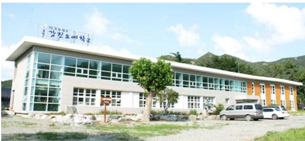
(그림3 강진 도예학교)

2009년 개교한 도예학교는 강진군이 전남도교육청으로부터 매입한 폐교 대구면 저두 분교를 리모델링해서 만들어졌다, 단국대학교 도예연구소가 전담하고 있는 이 학교는 3개월, 6개월, 1년 과정으로 전문 도예가를 양성하는 정규반 과정 이외에 지역민을 대상으로 한 특별강좌와 계절대학을 개설하고 있다. 지역 시설을 재활용한 방법적인 측면이나 강진청자박물관에서 하지 못하고 있는 지역 교육과 연구의 부분을 담당하고 지역 도예가 육성을 통해 도자산업을 발전시키고자 하는 내용적인 측면에서 좋은 계기로 보여 진다.