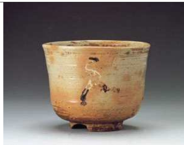
주문입학부산사발, 일본분류명 ; 어본입학다완 (御本立鶴茶碗) 고훈다씨쓰루자완, 노무라미술관

이것은 공식적으로는 부산의 왜관요에서 부산사발을 빚지만 비공식적으로는 양산의 법기리에서도 부산사발을 많이 제작했다는 사실입니다.