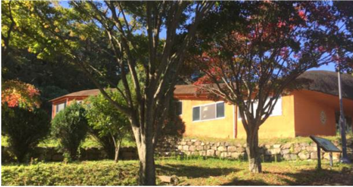
(그림5 충효동 도요지)