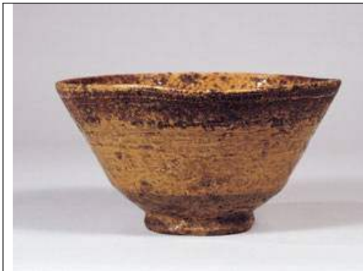
양산약토사발, 일본분류명, 황이라보다완(黃伊羅保茶碗) 석천가네자와현립 미술관

이것의 사금파리는 필자가 양산 법기리에서 많이 보았습니다만, 양산 법기리 이후에 조성된 부산 왜관내에 있던 왜관요에서도 빚은 것 같습니다. 이유는 일본에 발견된 약토사발중 아래에 등장하는 학이 그려진 사발의 학문양과 똑같은 문양이 새겨진 약토사발이 발견되었다 합니다.