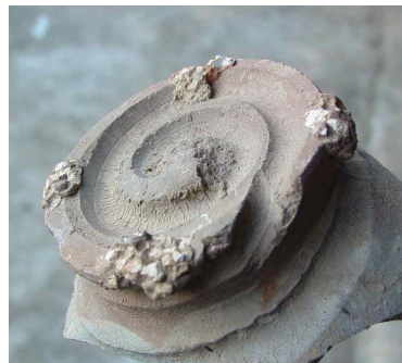
양산사발 볽기리출토 사금파리