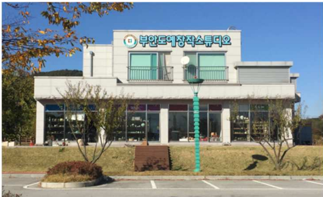
(그림11 부안 도예창작스튜디오)