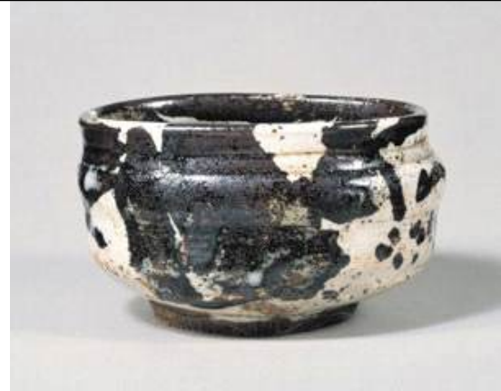
흑백각굽사발, 일본분류명 : 어소환다완(御所丸茶碗) 고쇼마루자완 미쓰이문고당 소장

아마도 도요토미의 한을 풀어주기 위해 붙인 분류명이라고 필자는 추정합니다.