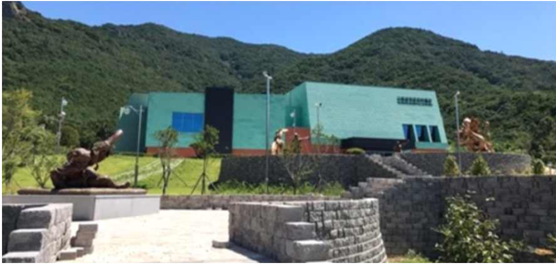
(그림7 고흥 분청문화 박물관)