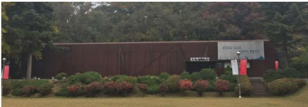
(그림12 분원 백자 자료관)