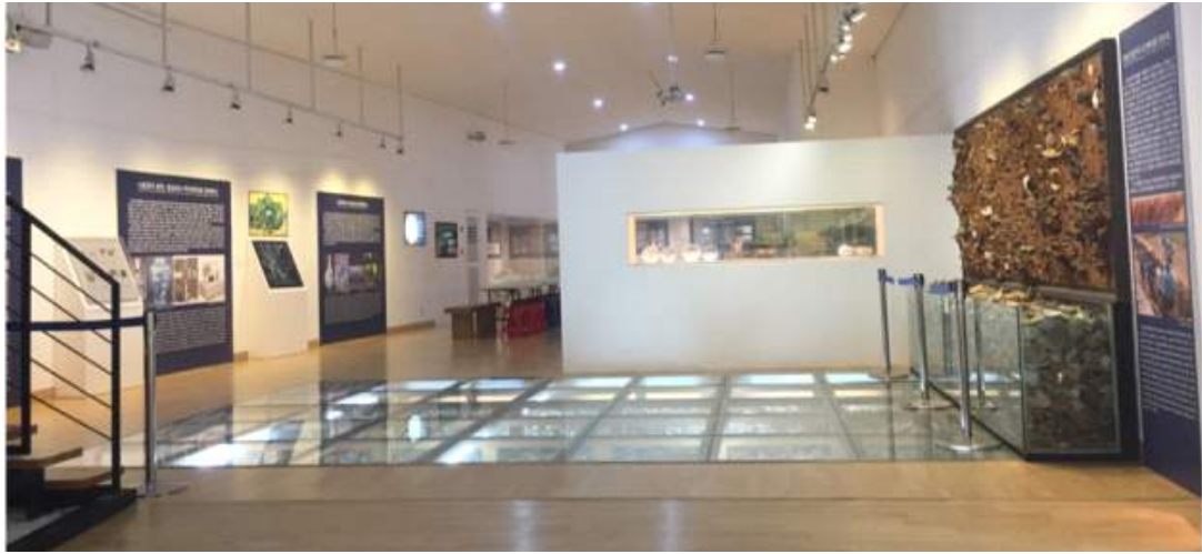
(그림13 분원 백자 자료관 내부)