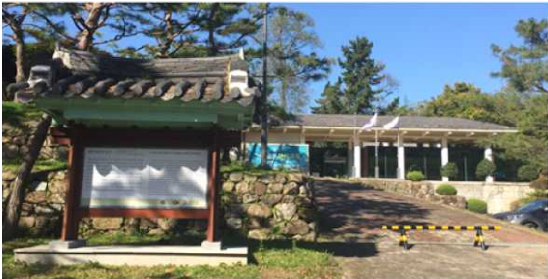
(그림4 무등산 분청사기 전시실)

퇴적층에는 상층에서 백자와 귀얄문, 그 밑에서 박지문(剝地紋)·조화문(彫花紋)·상감문(象嵌紋)·인화문(印花紋) 등이 출토되어 분청사기의 문양과 발달과정을 짐작할 수 있으며, 인화문 파편에는 ‘광(光)·광공(光公)· 정윤이(丁閏二)· 내섬시(內贍寺)’ 등의 명문(銘文)이 있어 지방 관요이면서도 중앙의 관수용품을 생산하였음을 알 수 있다