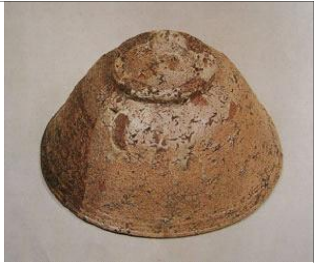
양산 이종유 사발

전체적으로는 붉은 끼를 띤 것과 파란 끼를 띤 것이 있으며 굽은 대나무 마디 모양으로 깎았으며 눈에 띠게 굽은 모래를 받쳐서 구웠다. 사발 동체에는 일본 차인들이 이시하제(石はぜ)라고 부르는 돌이 박힌 흔적이 멋스럽다.